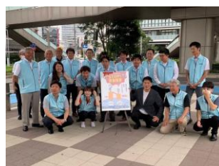
25(火) 三河西地協街頭活動