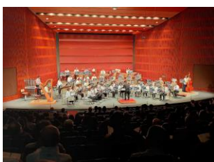
2(日) 知立市吹奏楽団ハートフルサト