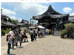
16(日) 子ども食堂ちりゅっ子かふえ