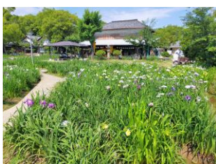
1(土) 知立公園花しょうぶまつり