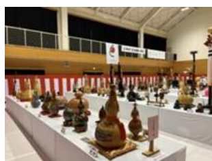
7(金) 全国愛瓢会知立大会