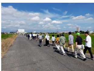
15(土) 市老連歩け歩け運動