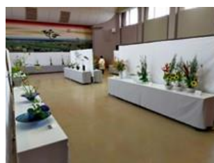
9(日) 知立市民文化のつどい華道部門