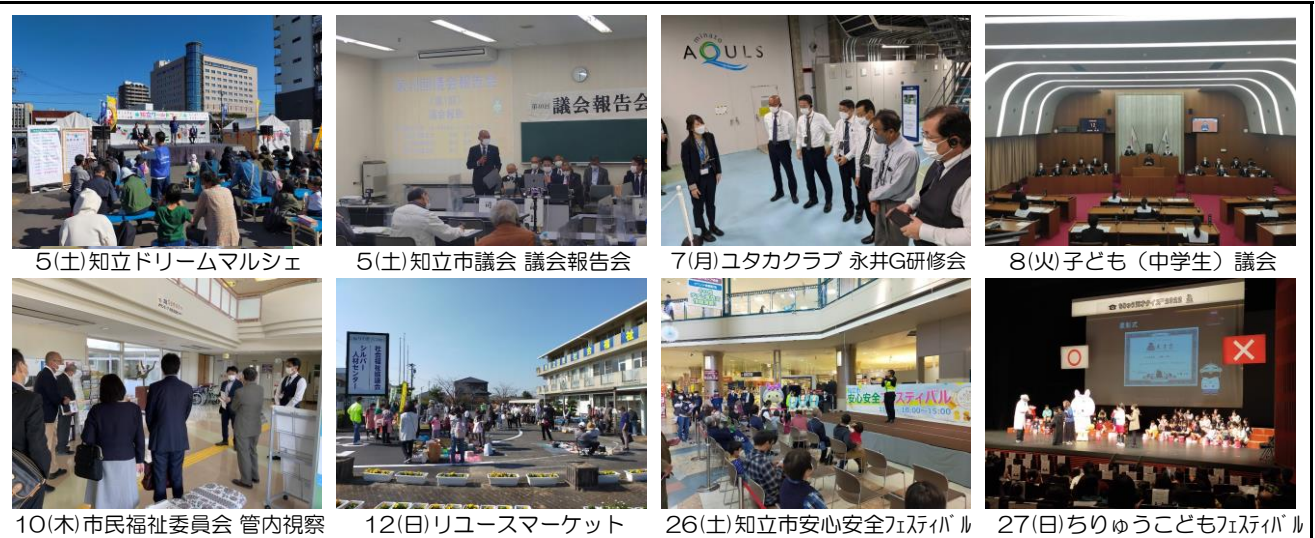
5(土)知立ドリームマルシェ