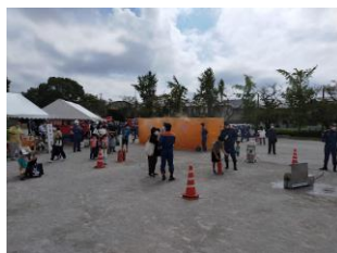
25(日)知立市総合防災訓練