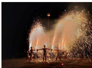
18(金)知立神社 秋葉社祭礼