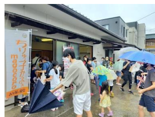
26(日) 子ども食堂 ちりゅうっ子がふえ