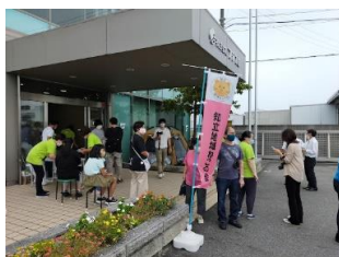
19(日) 知立地域ねこの会