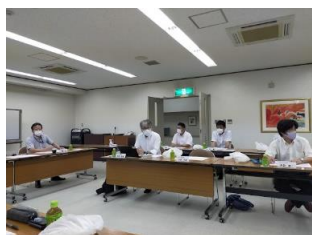
16(木) 三河西地協政策要望確認会