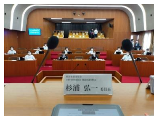
24(金) 建設水道委員会