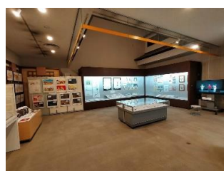
21(土) ウノ・カマキリワールド