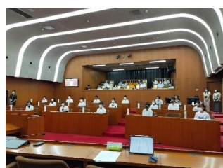
6(金) 高校生議会（市内3校）