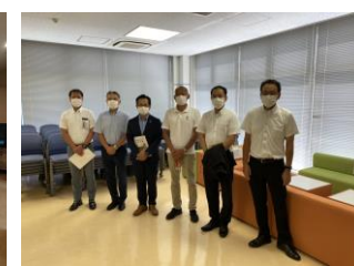
28(土) トヨタ自動車労組様 期初研修会