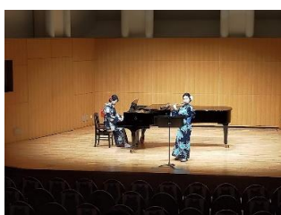
14(土) #19 リリオ・カミングコンサート