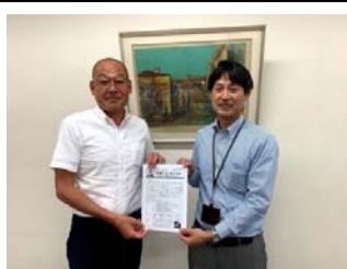
9(火) 中央発條労組訪問