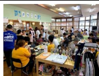
7(日) なないろマルシェ