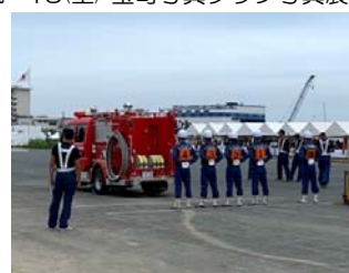
20(土) 愛知県消防操法大会