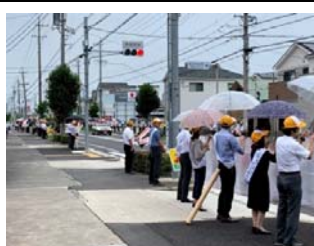
11(木) 夏の交通安全一斉街頭監視