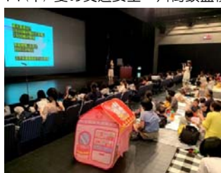
17(水) 防災ママカフェ@知立