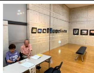
13(土) 宝町写真クラブ写真展