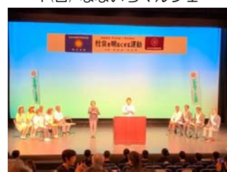
13(土) 社会を明るくする運動