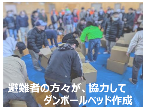
避難者の方々が、協力してダンボールベッド作成

先月、地区防災訓練に参加させていただきました。訓練では、安否確認～避難所を開設するまでの訓練でした。 訓練では、できる限り、避難してきた方々で避難所を立ち上げ、開設ができるように避難した方々にも協力いただきながら訓練を行いました。能登半島地区では、地震・豪雨災害での避難生活をしている方は、現時点でも400人を超えています。有事の際に減災できる取り組みの訓練含めた「備え」は重要です。今後も、安心・安全に暮らせるまちづくりを進めてまいります。