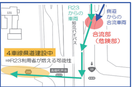
4車線県道建設中 ⇒R23利用者が増える可能性