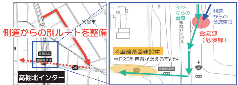
側道からの別ルートを整備

小垣江安城線の整備が進む前に、インター出口からの車 と側道からの車との交錯を防止することが必要！