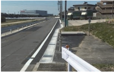
側溝蓋と電柱を移動し、道路を拡幅