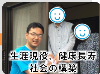
生涯現役、健康長寿 社会の構築