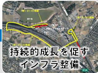
持続的成長を促す インフラ整備