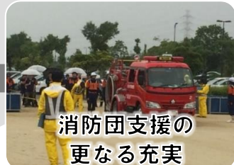
消防団支援の 更なる充実