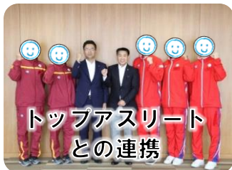
トップアスリート との連携