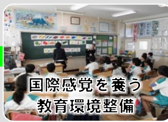
国際感覚を養う 教育環境整備