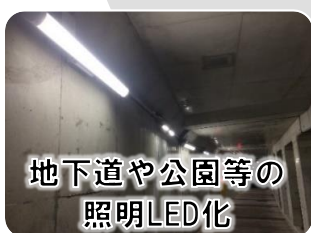
地下道や公園等の 照明LED化