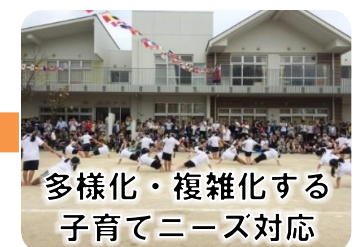
多様化・複雑化する 子育てニーズ対応