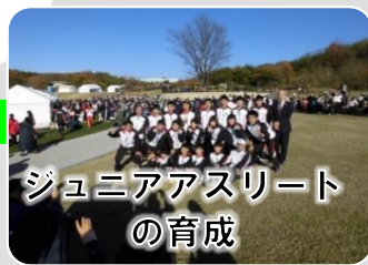
ジュニアアスリート の育成