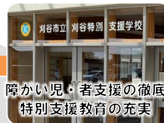
障がい児・者支援の徹底 特別支援教育の充実