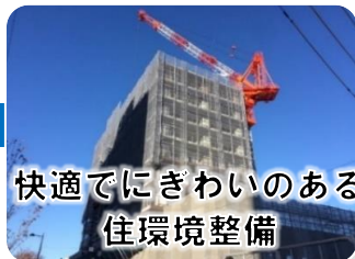
快適でにぎわいのある 住環境整備