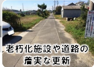
老朽化施設や道路の 着実な更新