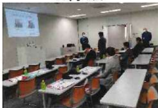
FCVフォークリフト活用研修 (豊田自動織機高浜工場)