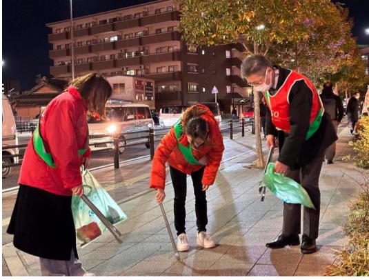
上／花と蝶のパトロール。刈谷駅周辺の店や会社が集まり、清掃をかねてパトロールを行います。 右／刈谷銀座にあるギャラリーディマージュというギャラリーで開催された陶雑店にご招待いただきました。陶器のお雛様、珍しくて可愛い。