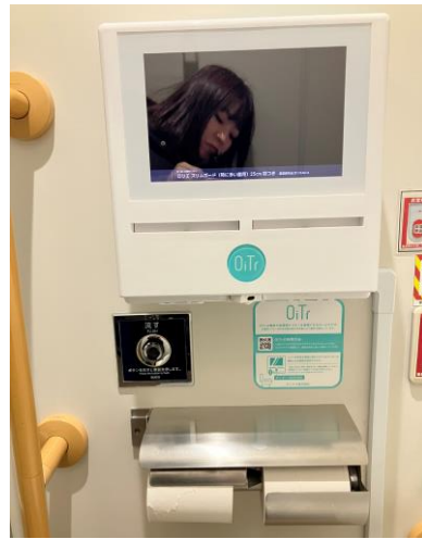
左／小中学校や幼稚園・保育園の卒業・卒園式に参列しました。晴れの門出に立ち合い、つい涙。 右／1月に東京・千葉に会派視察に行きました。写真は板橋区役所の女子トイレにある、生理用ナプキンベンダー。QRコードを読み込むと、ナプキンが1つ無料で出てきて、急な生理でも安心。フェムテック進んでいます！