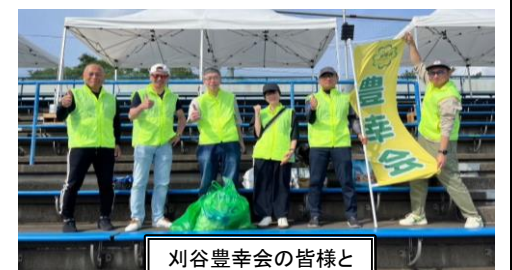
刈谷豊幸会の皆様と