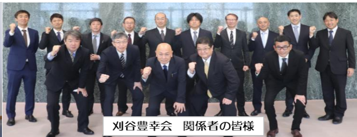
刈谷豊幸会 関係者の皆様