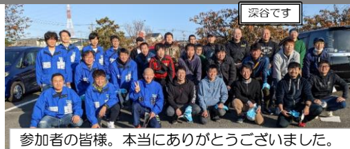
参加者の皆様。本当にありがとうございました。

(株) 豊田自動織機 技能職制3会の皆様が、地域貢献ボランティアとして今年も刈谷総合運動公園周辺の清掃活動を実施して頂きました。参加者の皆様のお陰でたくさんのゴミを集める事ができました。公園利用者の皆さんに心地よく公園を使って頂くことができます。