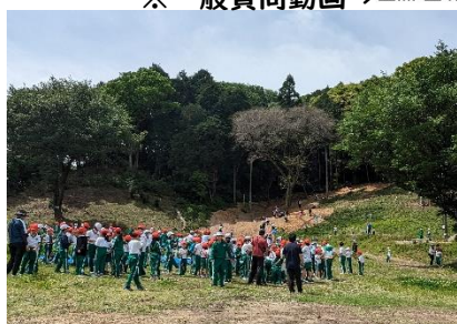
里山で環境課題を学ぶ小学生