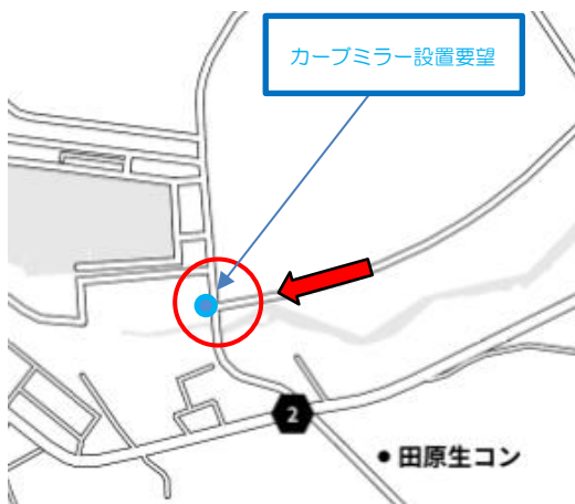
【 田原市白谷町白浜地内 】