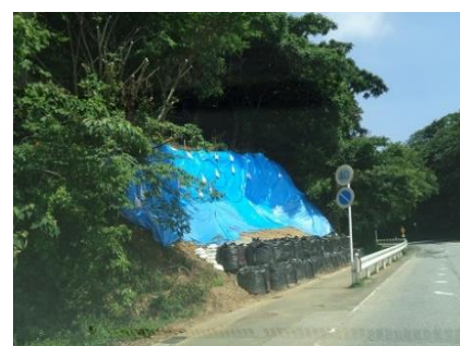
【 仮復旧対応の崩れた法面 】