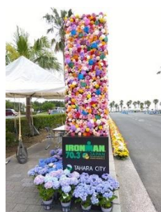
【 花でお迎え！ 】