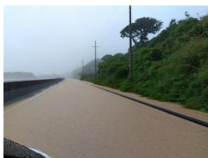
【 道路に溢れ出た泥水 】