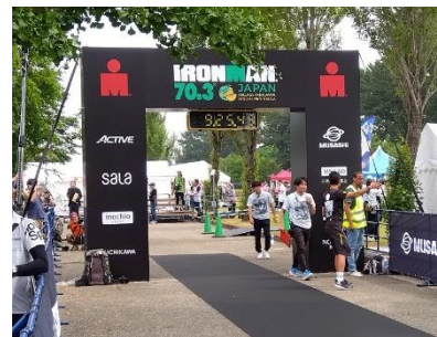
【 ゴールの豊橋総合スポーツ公園 】