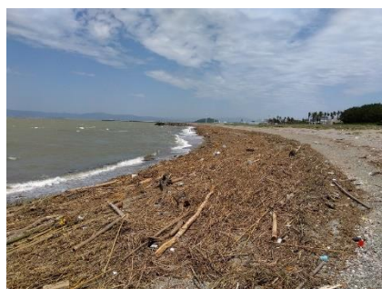
【 海岸に打ち上げられた流木等 】

*6月2日に発生した豪雨により道路、河川、海岸等、約400ヶ所に被害があった。現在、優先順位を付け順次、対応を進めている状況です。