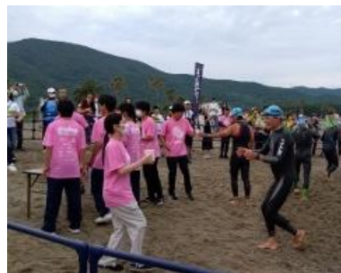
【 選手に給水するボランティア皆さん 】