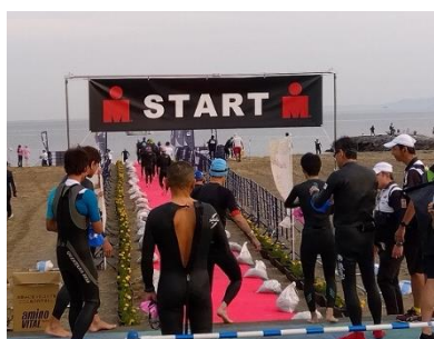
【 スイムスタート白谷海岸 】