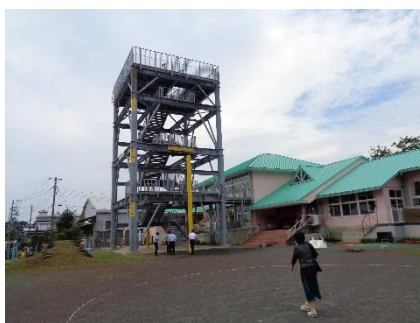
【②伊豆市：整備された津波避難タワー】