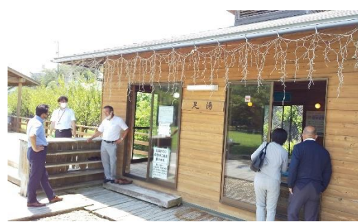
【③東伊豆町：足湯の整備・活用】