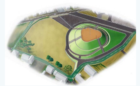
[ 津波避難施設 ]