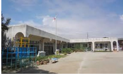
【 統合する赤羽根保育園 】

・高松、赤羽根、若戸保育園が統合。 あかばねこども園が令和3年度に開園。 運営事業者は、学校法人「正円寺学園」