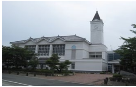
【 田原福祉専門学校 】

・田原福祉専門学校在民営化に向けて 福寿園と合同検討会がスタート。 令和3年度～ 新学校開校予定