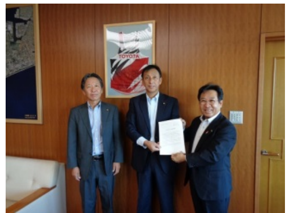
「山下田原市長に要望書提出」