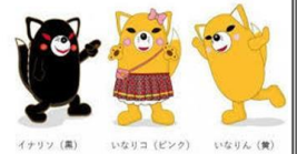
イナズマ(黒) いなりこ(ピンク) いなりん(黄)

具体的には、政策要望を7項目115細目提案しました。要望は、会派の一人ひとりが議員活動のなかで聴きとった意見を集約したものです。