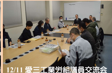
12/11 愛三工業労組議員交流会