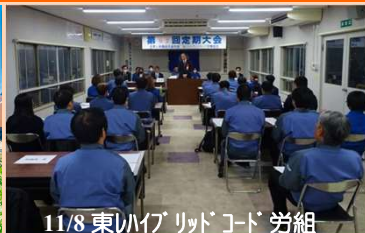
11/8 東川グッドコード 労組