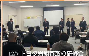
12/7 トヨタ労組春取り研修会