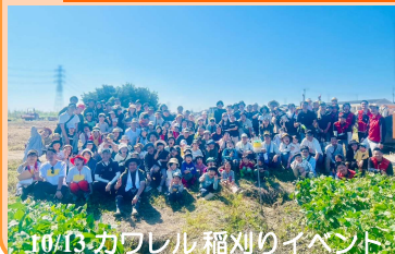
10/13 カワレル 稲刈りイベント