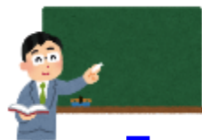
オンデマンド授業で講義映像や資料を送信