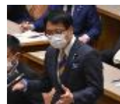
参議院運営委員会