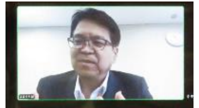
はまぐち参議院議員

また、 ふるもと伸一郎衆議院議員、はまぐち誠参議院議員 からもリモートで、ご挨拶がありました。