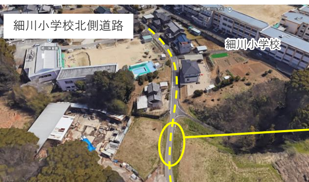
細川小学校北側道路