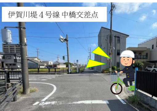
伊賀川堤4号線 中橋交差点

【要望内容】元能見町地内の交差点において、右から来る車両（自転車含む）が見えにくい。