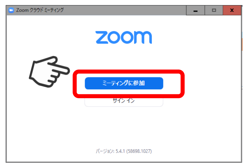
画像② インストール後に表示される画面