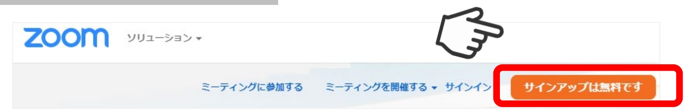
画像③ Zoomのホームページ画面

Zoomのインストール後に、ご自身のアカウントの作成をしてください。 インストール後に表示される画面で「ミーティングに参加」をクリック（画像②）、 または、Zoomのホームページにアクセスして頂き、「サインアップは無料です」のボタンをクリック（画像③）し、 表示された画面で必要情報を入力し、アカウントを作成してください。