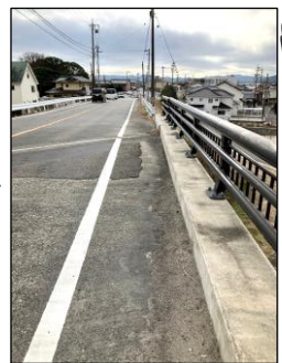
皆さまからの相談 歩道の除草